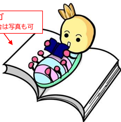
生駒ビブリアオ倶楽部マスコットキャラクター ほんのむしくん